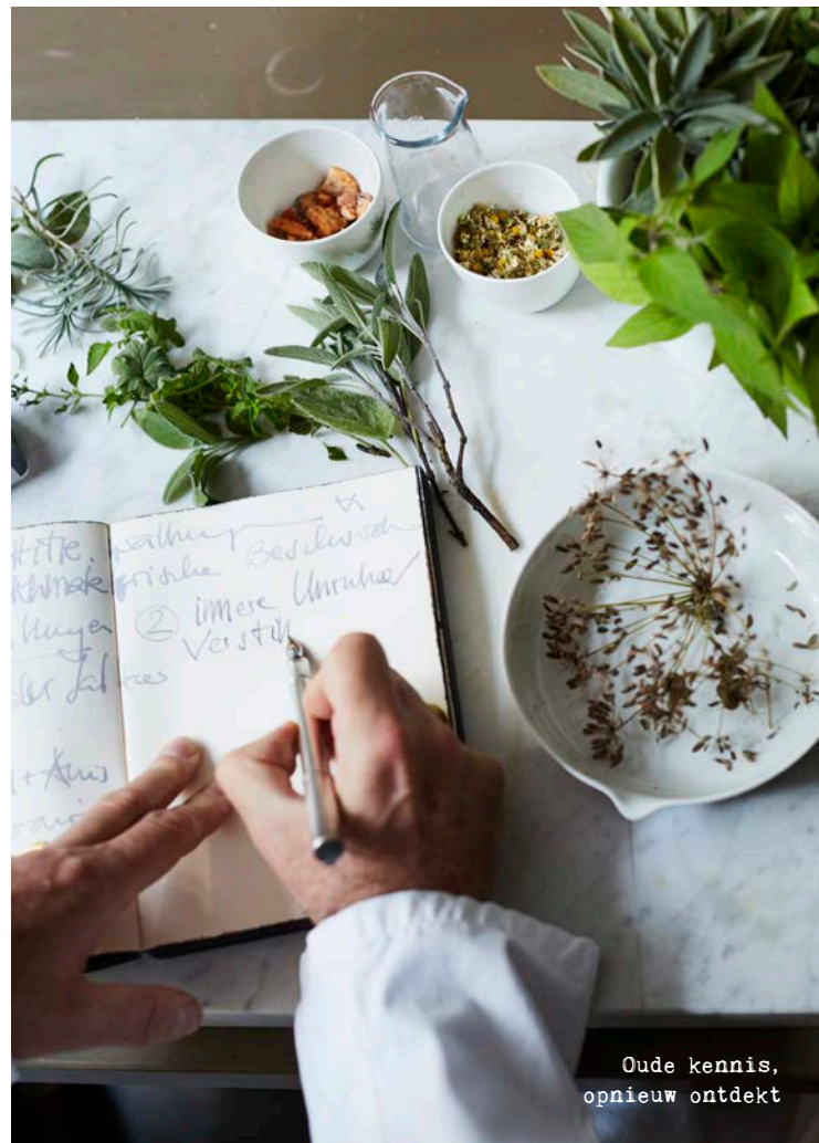
Oude kennis, opnieuw ontdekt

Hij dacht meteen aan de Heilsalbe 22, een product dat nog door zijn opa was ontwikkeld. "Als ik als kind thuiskwam met een pijnlijke schaafplek of wond, gaf mijn moeder me die zalf altijd. 'Hier, smeer dat erop, dan is het morgen weer over.' En inderdaad, het hielp altijd razendsnel."