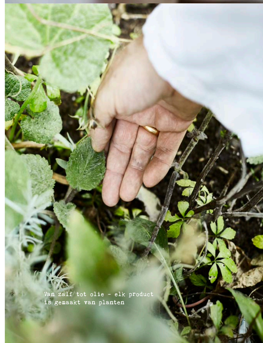
Van zalf tot olie - elk product is gemaakt van planten